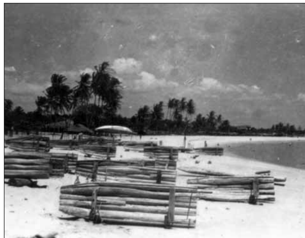
Figura 15. Jangadas em Fortaleza.