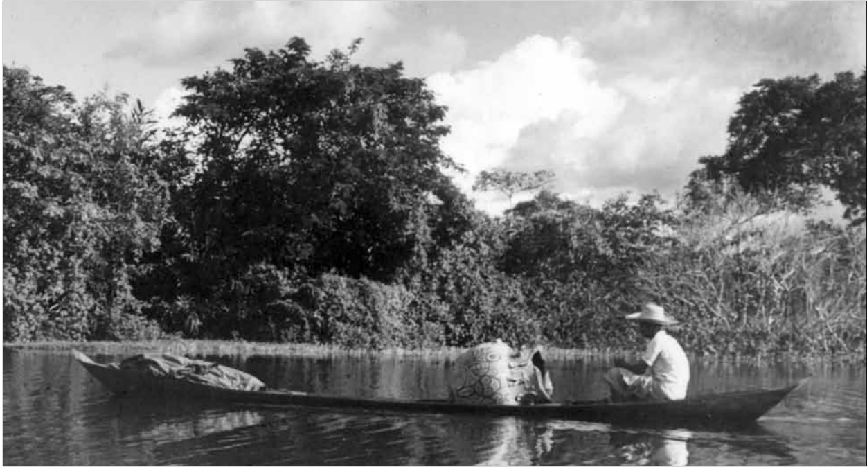
Figura 9. Urna marajoara durante o transporte.