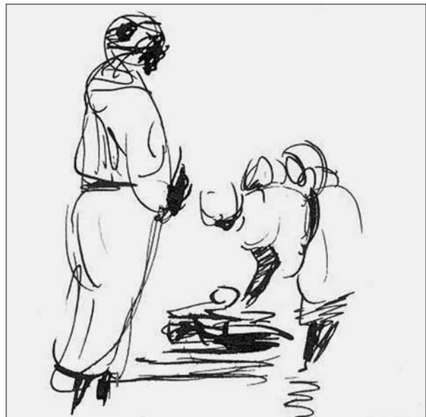
Figura 2. O mercado de Meknes, em Marrocos. Desenhos em nanquim de Peter Paul Hilbert, datados de 1943.

Sua estada em Marrocos, longe dos combates da guerra, durou até a chegada dos aliados no norte da África,