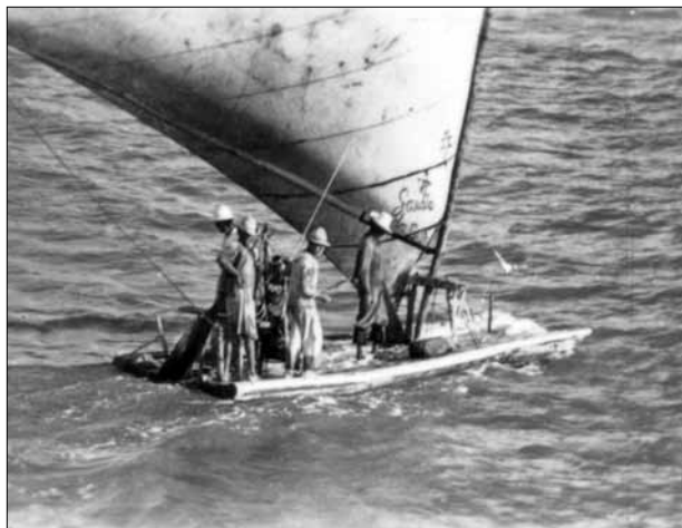
Figura 14. Jangadas em Fortaleza.