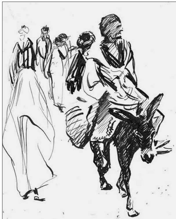
Figura 4. O mercado de Meknes, em Marrocos. Desenhos em nanquim de Peter Paul Hilbert, datados de 1943.

No final da grande guerra, Peter Paul conseguiu, junto com um grupo de soldados alemães que estava em