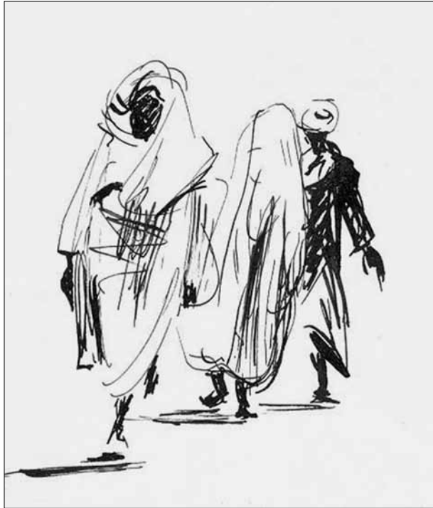
Figura 5. O mercado de Meknes, em Marrocos. Desenhos em nanquim de Peter Paul Hilbert, datados de 1943.

casas e famílias destruídas, meu pai não quis voltar e optou por mais uma aventura em sua vida, embarcando em um navio de Gênova para o Rio de Janeiro.